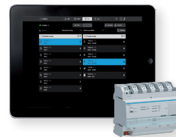
Configurateur Easy (tablette non livrée)

Easy est simple, intuitif et polyvalent ; il convient particulièrement à une utilisation en milieu scolaire.