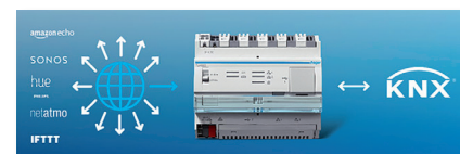
Option contrôleur IoT