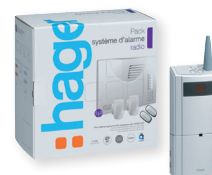
Kit alarme intrusion radio KNX